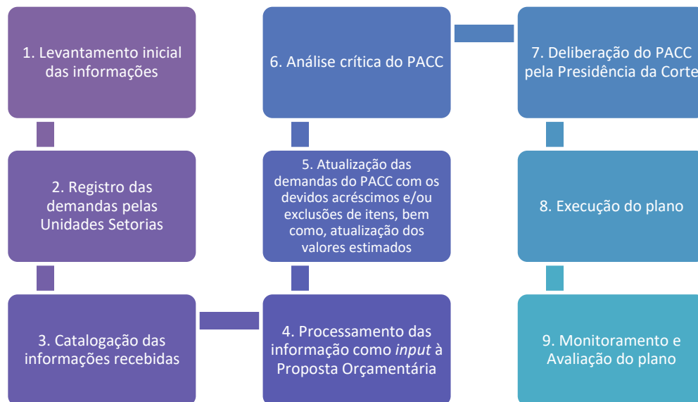
Imagem 01: Fluxo dos procedimentos inerentes às etapas de construção do PACC 2022.

No fluxograma abaixo, é demonstrado sinteticamente as fases de elaboração e execução do PACC: